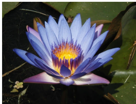
Fleur de lotus